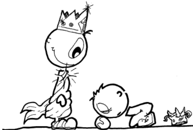
Jézus az Úr! Róm 10,9